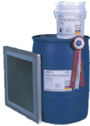
440-R® SMT detergent